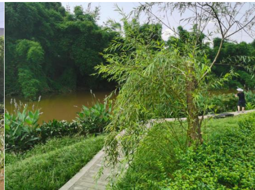
现状竹林梳理段岸坡