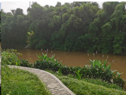
现状竹林梳理段岸坡

3、YK1+575.65~YK3+807.07 绿化梳理段，河段岸坡长 2231.42m；现状岸坡为已成护岸，局部岸坡未做处理，表土外露，存在洪水冲刷风险，沿线植被杂乱无章。