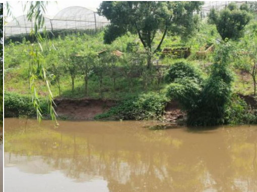
护岸段岸坡侵蚀现状

2、YK0+678.55~YK1+575.65 现状竹林梳理段，河段岸坡长 897.1m；现状岸坡偶有岩石出露，岸坡覆盖层较薄，岸边多为竹林；现状岸坡地面凹凸不平，局部竹林杂乱无章。