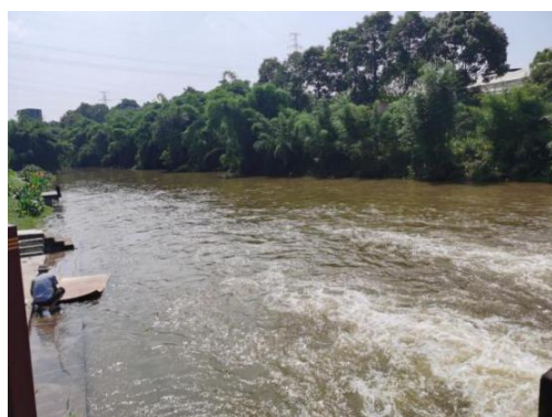
现状竹林梳理段岸坡

2、YK0+678.55~YK1+575.65 现状竹林梳理段，河段岸坡长 897.1m；现状岸坡偶有岩石出露，岸坡覆盖层较薄，岸边多为竹林；现状岸坡地面凹凸不平，局部竹林杂乱无章。