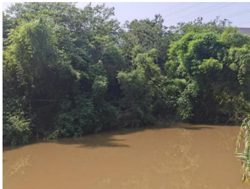
现状竹林梳理段岸坡

4、YK3+807.07~YK4+589.56 现状竹林梳理段，河段岸坡长 782.49m；现状岸坡坡面较为平缓，岸边多为竹林；现状岸坡地面凹凸不平，局部竹林杂乱无章。